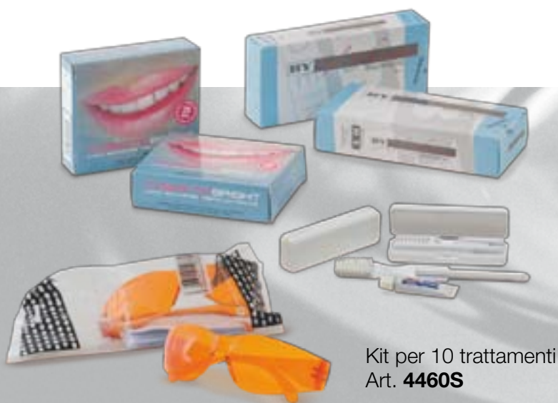
Kit per 10 trattamenti Art. 4460S

e potrete garantire ai vostri clienti un sorriso smagliante! È semplicissimo: date loro il pratico spazzolino con dentifricio fornito con il kit DeaLux. Una volta lavati i denti applicare la mascherina Cosmetic Bright, mettere gli occhiali e attivare la lampada per 20 minuti a 10 cm di distanza. Consegnate un flacone di Gel Whitening da applicare a casa nei giorni successivi.